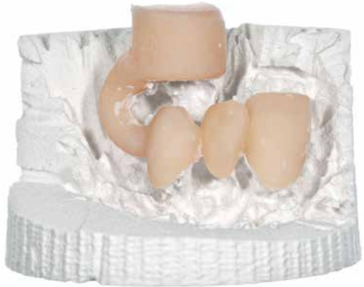
Ponte com um sprue de 4 mm..

Se utilizar o revestimento Celtra® Press, não é necessário nenhum gel ou líquido de ácido fluorídrico.